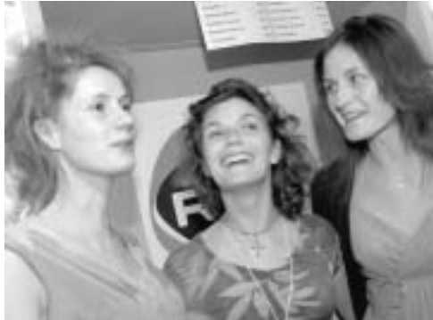
Au bar, les filles s'amusent bien en attendant le public des Estivales.