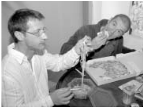
Indésirables SDF aux Estivales du Rire : après la salle de bain, la salle à manger !