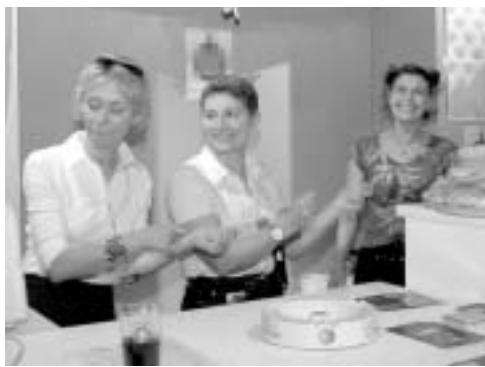
Plus tard au bar... L'accueil et les chauffeurs s'en mêlent pour ambienter !!... Ça va chauffer !