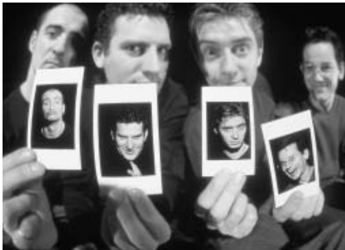
Les Joyeux Urbains montent sur scène avec leur spectacle "Super Sexy". Urbains... sûrement ; joyeux... à n'en pas douter... mais aussi féroces et drôles, généreux et émouvants. Un vrai miel pour nos oreilles !

Après avoir fait les 1ères parties de Jacques Higelin, Macéo Parker, -M-, les Wriggles, Têtes Raides, Pigalle, Philippe Val et tant d'autres, Les Joyeux Urbains se produisent maintenant en vraies vedettes ! Urbains... sûrement ; joyeux... à n'en pas douter... mais aussi féroces et drôles, généreux et émouvants. Sur un groove acoustique remarquablement maîtrisé, ces quatre garçons nous servent des textes délicats et loufoques, le tout nappé d'une prestation scénique époustouflante. Entre java et rock, Les Joyeux Urbains ont le propos cinglant et le trait caricatural. Rire jaune, humour noir ou poésie, ils amusent, déconcertent et séduisent.