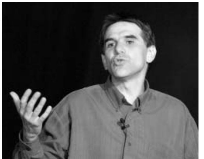
Magnifique Tex. Aucun doute, c'est un super spectacle, et le public ne s'y est pas trompé.

Demain, à la discothèque des edr : SOIRÉE COSTUMÉE "JUNGLE"