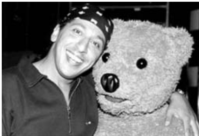
Smaïn avec un de ses héros : Nonnours.

Comment parler de Smaïn en 4 petites lignes ? En vous parlant du comédien, de l'artiste de music hall, du chanteur, de ses fameuses baskets rouges ?