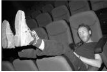
Le repos du Guerrier, quelques minutes avant la scène !