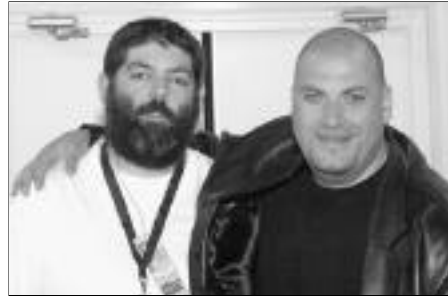
Rencontre au sumo : 250 kilos point con (enfin pas trop...).