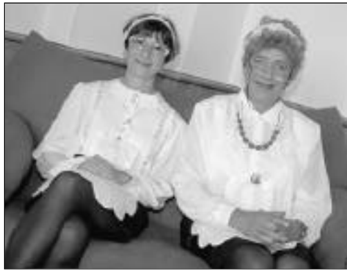
Les soubrettes de l'Entracte Café. La Compagnie du P'tit Grain se lâche !