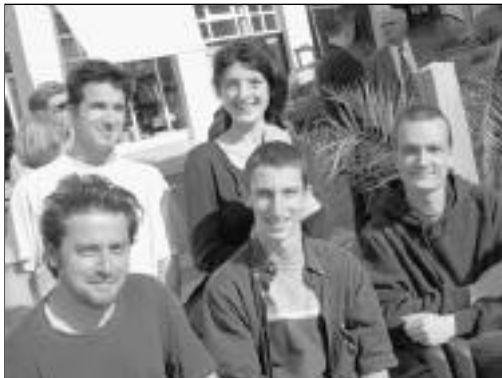
La Crevette d'Acier au grand complet.